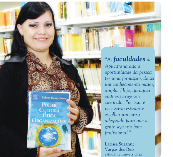
"As faculdades de Apucarana dão a oportunidade da pessoa ter uma formação, de ter um conhecimento maior, amplo. Hoje, qualquer empresa exige um currículo. Por isso, é necessário estudar e escolher um curso adequado para a gente seja um bom profissional."

Sempre que você fala bem de Apucarana todo mundo sai ganhando.