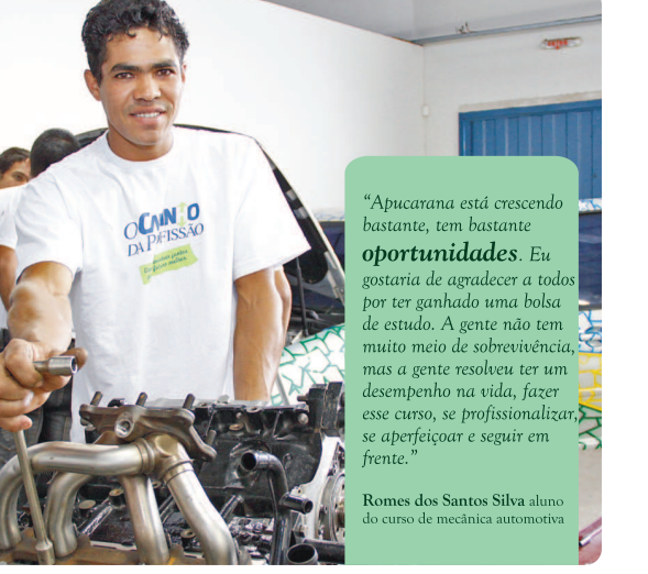
"Apucarana está crescendo bastante, tem bastante oportunidades. Eu gostaria de agradecer a todos por ter ganhado uma bolsa de estudo. A gente não tem muito meio de sobrevivência, mas a gente resolveu ter um desempenho na vida, fazer esse curso, se profissionalizar, se aperfeiçoar e seguir em frente."

Sempre que você fala bem de Apucarana todo mundo sai ganhando.