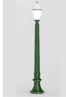
DETALHE 1: POSTE REPUBLICANO